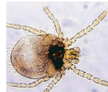
Larven van de oogstmijt A

Daarna laten ze los en zetten hun ontwikkeling voort als vrij levende stadia op de grond. Ook de mens en andere dieren kunnen geïnfecteerd raken.