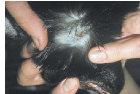
Dermatitis veroorzaakt door oogstmijten C