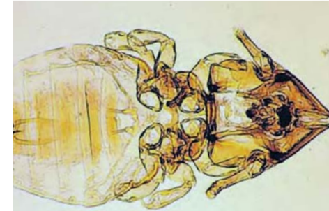
Felicola subrostratus A

De ligplaatsen en vachtverzorgingsmaterialen dienen gewassen te worden en de omgeving en elke ander contactgebied gecontroleerd om overdracht naar andere dieren te voorkomen 2 .