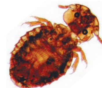
Trichodectes canis A