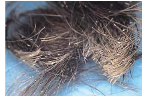
Neten in de vacht A