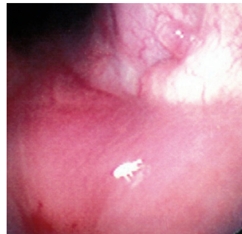
Endoscopisch beeld van neusmijten H