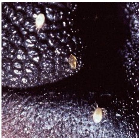
Neusmijten in de neusgaten van een hond J

Indirecte overdracht door materialen zoals ligplaatsen en in kooien en kennels kan niet worden uitgesloten, aangezien deze parasieten tot 20 dagen kunnen overleven buiten hun gastheer.