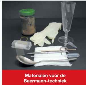
Materialen voor de Baermann-techniek

Vorkom, indien mogelijk, dat honden (naakt) slakken opnemen.