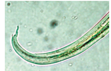
A. vasorum larven zijn ongeveer 345 µm lang en hebben een karakteristieke staart met een dorsaal uitsteeksel A