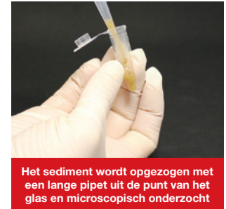
Het sediment wordt opgezogen met een lange pipet uit de punt van het glas en microscopisch onderzocht