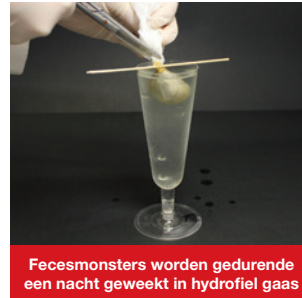
Fecesmonsters worden gedurende een nacht geweekt in hydrofiel gaas