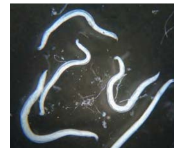
Haakwormen zijn kleine rondwormen die leven in de dunne darm van geïnfecteerde honden