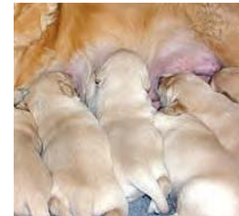
Pups kunnen geïnfecteerd worden tijdens het zogen

Uit de eieren komen larven die zich ontwikkelen tot infectieuze L3-larven in de omgeving. Deze larven worden vervolgens opgenomen en ontwikkelen zich binnen 2 tot 3 weken tot volwassen wormen.