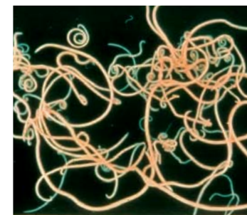
Volwassen wormen leven in de dunne darm van geïnfecteerde katten