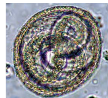
Toxocara cati infectieus ei