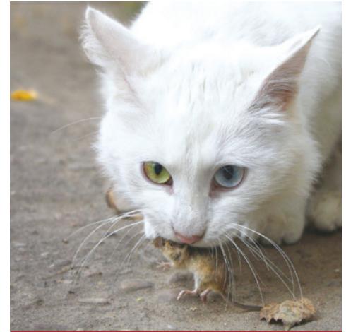
Jachthonden en zwervkatten lopen een hoger risico op infectie

Voer honden geen onvoldoende verhit of rauw vlees en voorkom contact met ingewanden of karkassen.