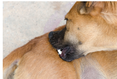
Dieren kunnen zich overmatig wassen

De behandeling van contactdieren, met name van dezelfde soort, wordt sterk geadviseerd, ook als deze dieren geen symptomen van besmetting tonen. Het reinigen van de omgeving, inclusief het wassen van de rustplaats en dekens en stofzuigen, draagt bij aan het bestrijden van mijten in de omgeving. Eigenaren kunnen tijdelijk besmet raken na contact met geïnfecteerde dieren, wat gepaard kan gaan met huiduitslag 2 . De klinische symptomen van de eigenaar verdwijnen na behandeling van het dier.