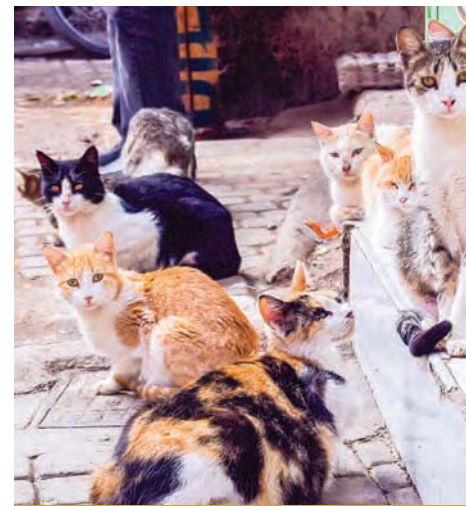
Notoedres mijten kunnen zich snel verspreiden binnen een groep katten

Het is belangrijk om alle contactdieren te behandelen en besmette ligplaatsen te vervangen 2 .