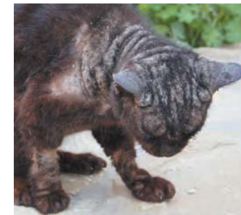
Notoedres cati infectie F