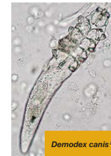
Demodex canis A