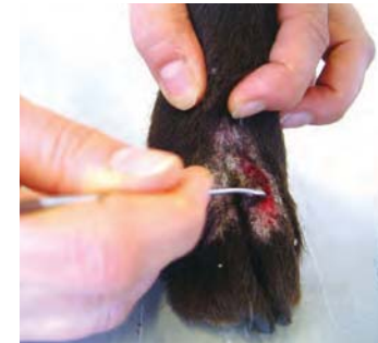
Het nemen van een huidafkrabsel B

De algehele gezondheid van het dier moet beoordeeld worden met speciale aandacht voor aandoeningen die het immuunsysteem kunnen onderdrukken. Hieronder vallen een slechte verzorging, inadequate voeding, endoparasieten en onderliggende aandoeningen. Om een toename in prevalentie van canine demodicose te voorkomen wordt geadviseerd om niet te fokken met een hond met gegeneraliseerde demodicose en getroffen dieren te castreren/steriliseren.