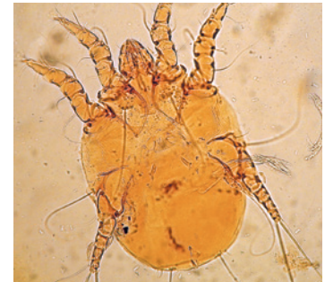
Otodectes cynotis 1