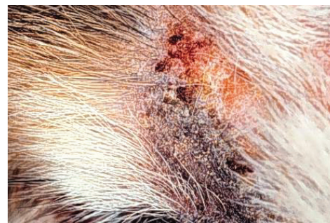
Mijten kunnen een dermatitis veroorzaken M