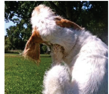
Jeuk met krabben aan het oor B