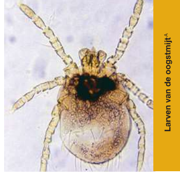
Larven van de oogstmijt A

De larven klimmen in de vegetatie waar ze wachten op passerende gastheren. Er vindt geen overdracht tussen dieren plaats en na vasthechting op een gastheer voeden de larven zich meerdere (5-7) dagen met enzymatisch vloeibaar gemaakt weefsel, epitheliale secreties of bloed.