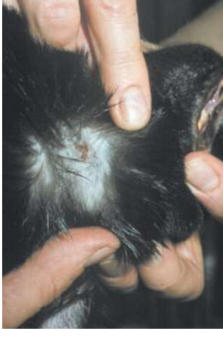
Dermatitis veroorzaakt door oogstmijten 3